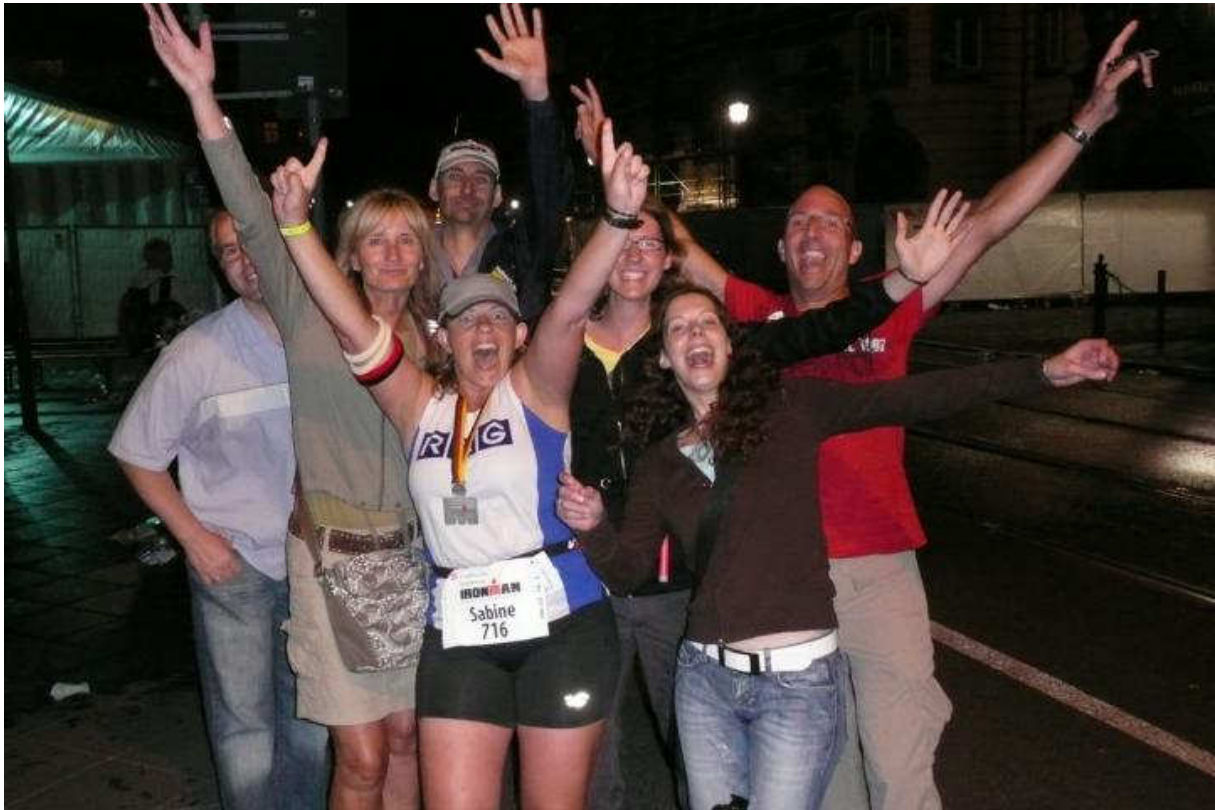
Danke an alle Freunde an der Strecke

Das war er also der "Längste Tag des Jahres". Dann noch die Fahrräder und Beutel abholen und gegen 2:00 Uhr liegen wir im Bett. Seit diesem Tag klappert es wenn ich Sabine in den Arm nehme.....Eisen auf Eisen eben.